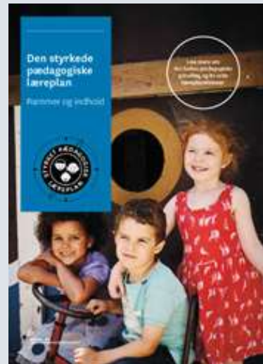
Den styrkede pædagogiske læreplan, Rammer og indhold

Denne skabelon indeholder alle de lovmæssige krav til evalueringen.